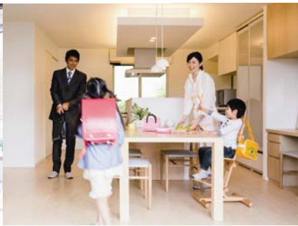
<朝は慌ただしい子世帯>