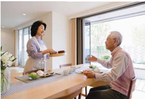
<ゆっくりと朝食を採る親世帯>