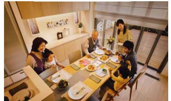
<週末は家族全員でコミュニケーション>